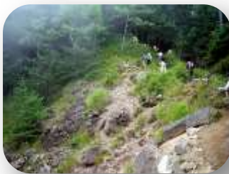
霧が下から吹き上げてくる