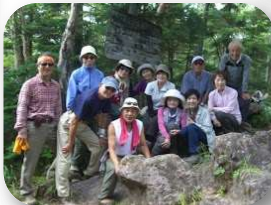
うしろの看板には「牛首山」とあります