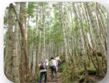
シラビソの林を抜けて