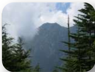
牛首山山頂で権現山