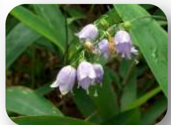
ヤマホタルブクロ