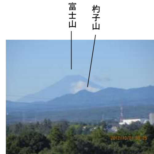
市役所6Fから見た山々

(この表は、距離はおおよそで直線距離。角度は市役所位置から分度器をあてて計りました。 磁北は7度です)